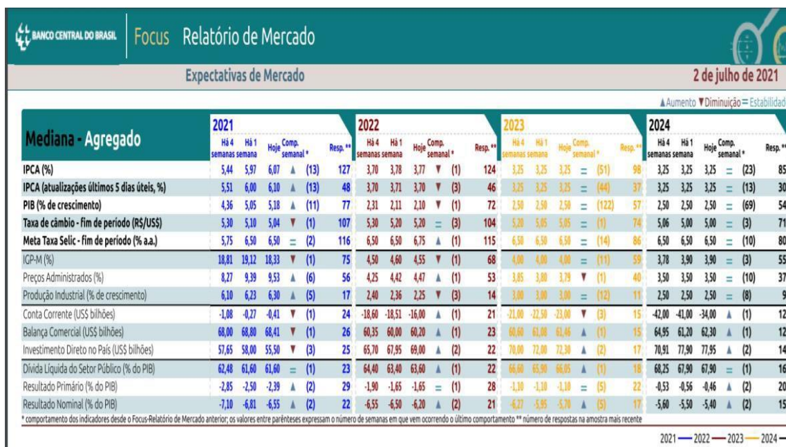
Figura 1 – Relatório Focus do Banco Central do Brasil