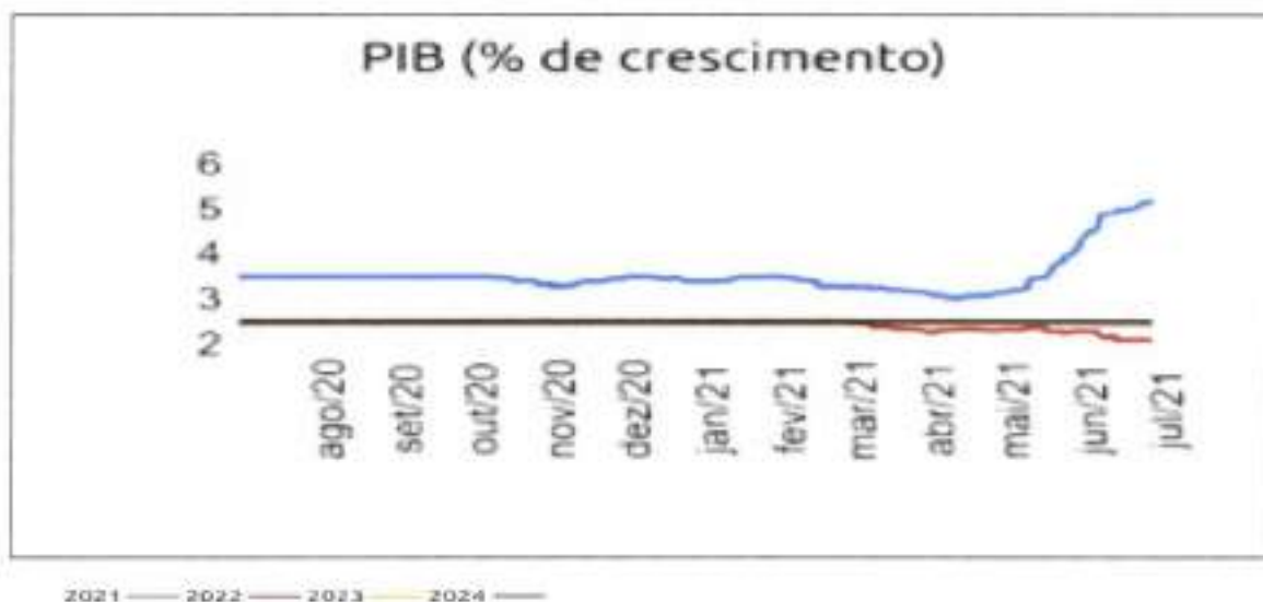
Figura 3: Projeções de Crescimento do PIB