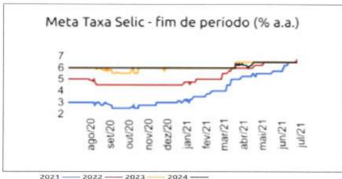
Figura 4: Projeções da Taxa de Juros Selic (% a.a.)