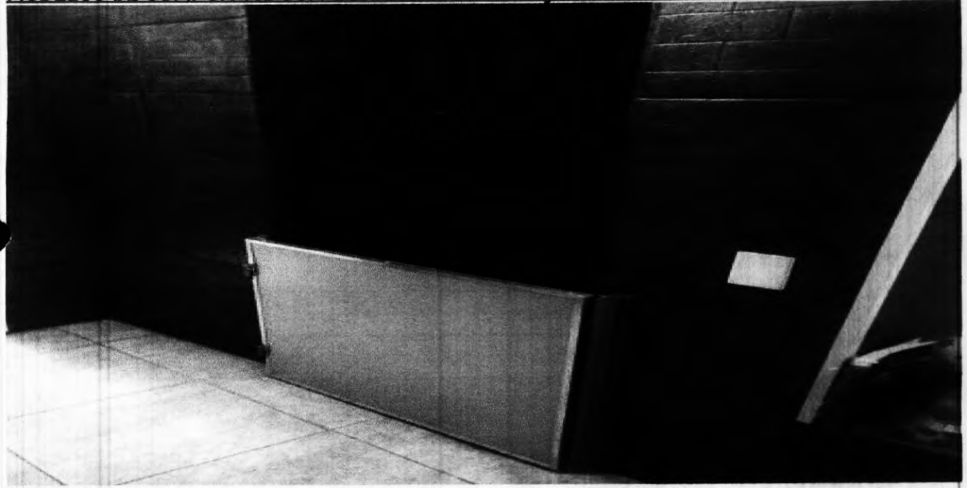
MODELO - 02